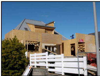
Avril 2012 pose de l'ossature bois