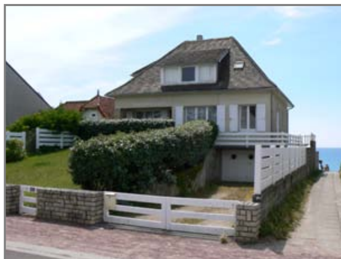
Janv 2012 début du chantier