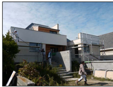
Sept. 2012 application de l'enduit