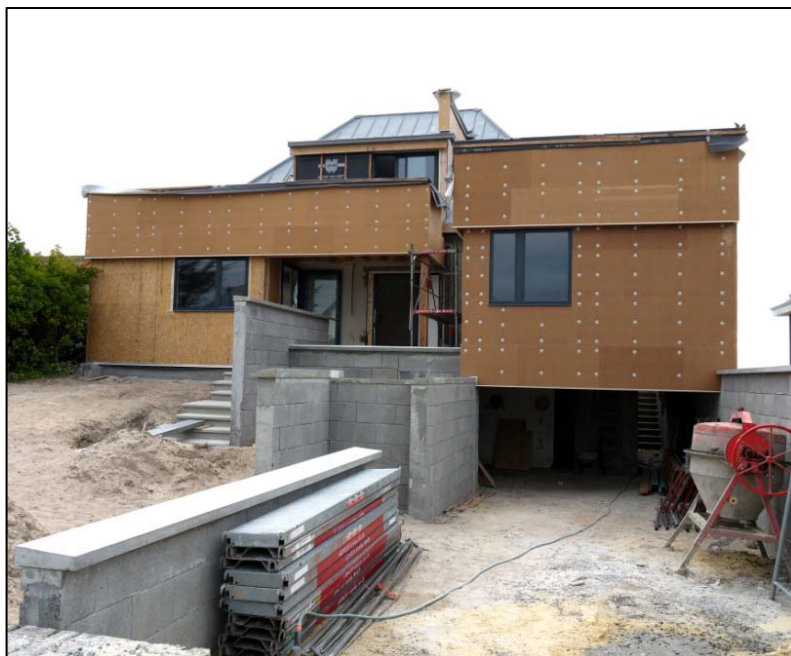
Juin 2012 isolation en fibre de bois

150 m 2 d'extension isolée par des matériaux bio-sourcé